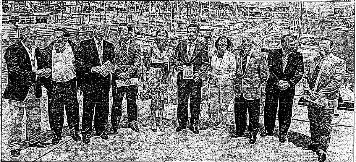
► La XIV edición de la Regata Costa Azahar fue presentada ayer en el Real Club Náutico de Castellón bajo una gran expectación.

El RCN Castellón apuesta también este año porque la Regata Costa Azahar cumpla con su atractivo de concentrar a la mejor flota de alto nivel, pero también, por convertirse en un medio de promoción para el deporte de la vela. Para ello, se potenciarán